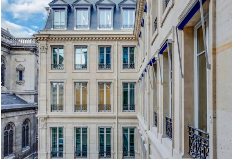
Rénovation basse consommation Le Théodore - Studios Architecture - Paris (75009)

Il faut savoir que les bâtiments d'avant 1948, -pas tous les bâtiments d'avant 1948 n'ont un intérêt patrimonial, mais globalement cela donne une idée - c'est un tiers du patrimoine bâti en France, donc forcément c'est un des sujets de rénovation en général, rénovation énergétique en particulier.